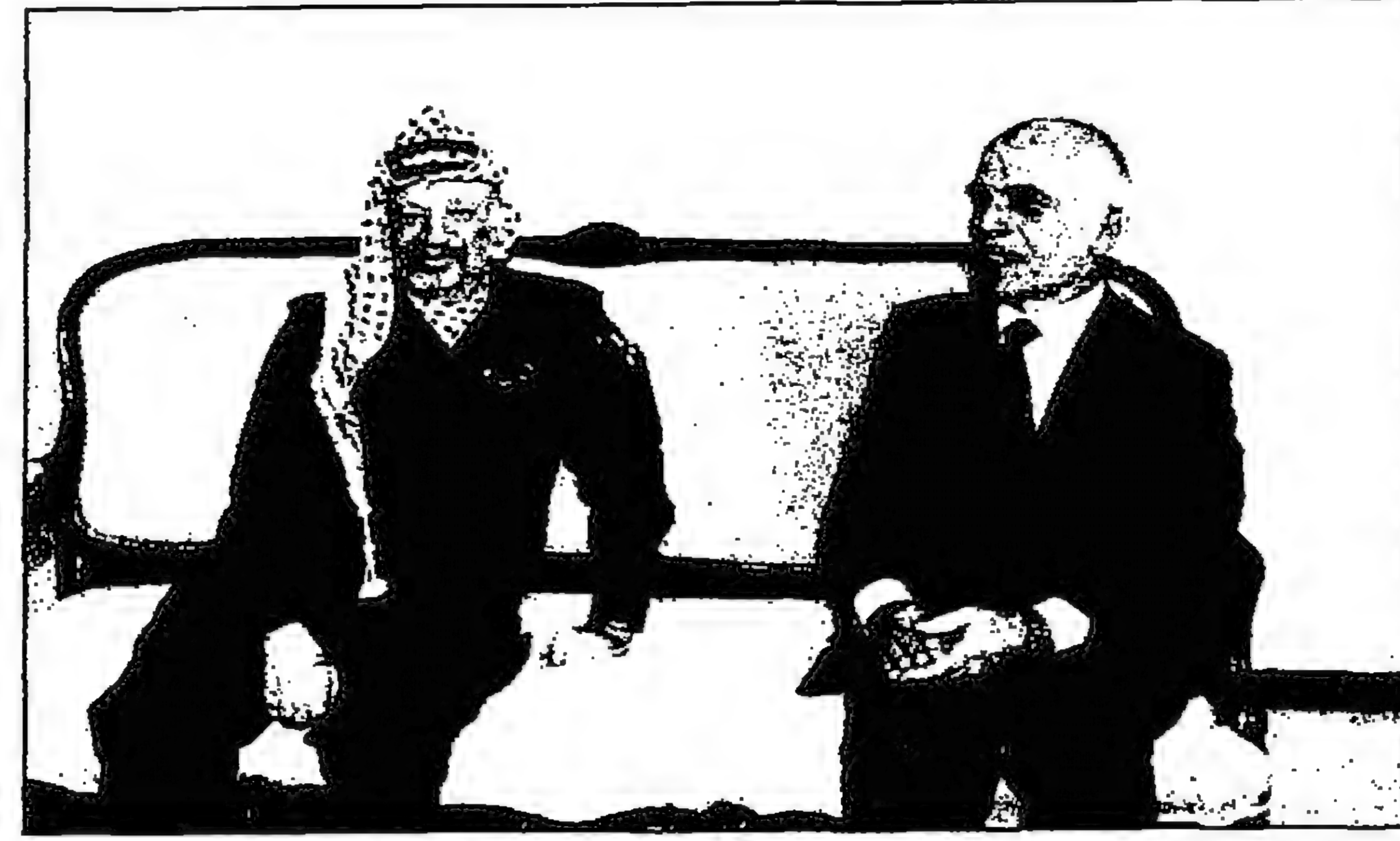
العلاقة الأردنية الفلسطينية: الاستقلال طريق الوحدة

عندما نتعلق من نقطة معينة بحكومة بعدد من الضوابط والمؤسسات التي تشكل ضمان العودة لتصبح الحارس العودى به الى قطعه الاساسية في حال طرأ أي تغير او انحراف في اتجاهه مفاهيمي، لكن للأسف في مجتمعات العالم الثالث بشكل عام عندما يتصرف الحارس يتواصل ويستمر جراه غيبا مثل هذه الضوابط والمؤسسات، وتبدأ الخطوة التالية من قطعه الانحراف وليس من تقوية اللبنة، ويصبح الخط سائرا اما على اليمين او على اليسار وليس في اتجاهه الأساسي تصبح نقطة البداية نقطة المعيار وليس النقطة الاساسية او نقطة البداية، ويبنى عليه باستمرار، ولهذا السبب وصل مجتمعنا العربي الى الوضع الذي شرحته لنت في سؤالك.